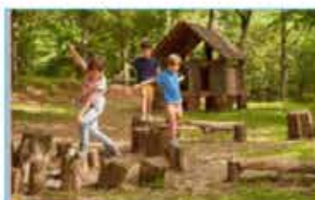
K Aventura en la naturaleza