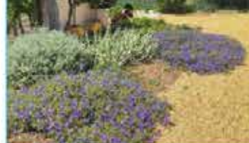
B Jardín divulgativo