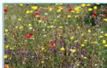
N Pradera natural

Accede con tu móvil a la noticia de Canal Norte Digital