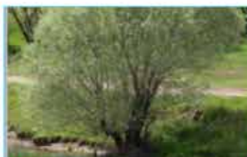
I Bosque de ribera