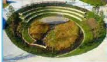
A Aula abierta