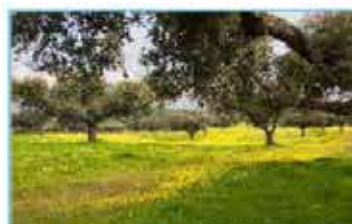
L Bosque mediterráneo