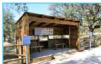
D Observación de aves