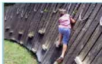
F Terreno de juegos