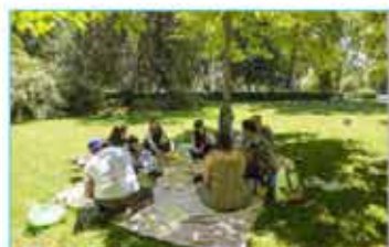
J Praderas estanciales