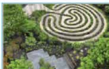
E Jardín terapéutico